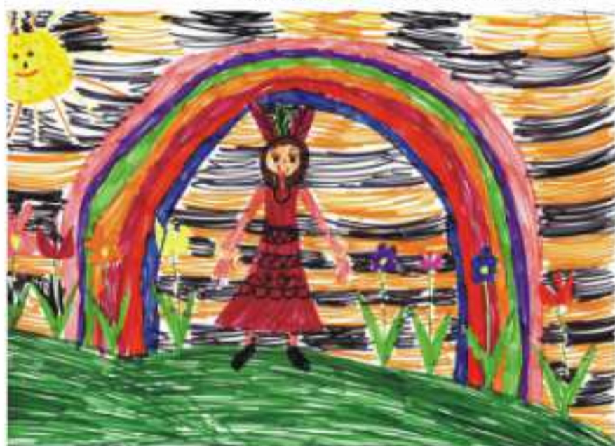
Камелия Росенова – III