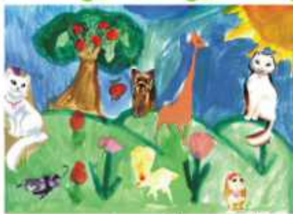
Фелин - I „в“ клас

Снощи мойто мило мече Сладка дума то ми рече: -Сядам, бате, аз да ям да порасна като теб голям! ВИКТОРИО КРЪСТЕВ – III „б“ клас