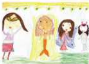
Надежда Стоянова- II „в“ клас

1. Голяма река в България. 2. Най-горещия сезон. 3. Постелка за леглото. 4. Голям и сочен дъден плод. 5. Състени въздушни пари. 6. Агрегатно състояние на водата. 7. Птица. 8. Трицифрено число. 9. Част от тълпата. 10. Косметик на главата образуват... 11. Голям християнски празник, на който се бодневат вина.